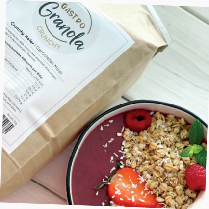
CRUNCHY HAFER GRANOLA