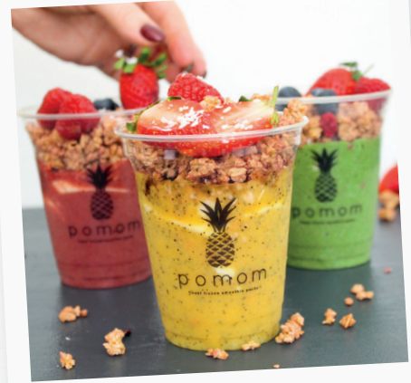
AUCH ALS TO GO GEEIGNET

Unser Knusper Granola besteht aus 100% naturbelassenen Zutaten und ist die ideale Basis als Smoothie-Bowl-Topping und als Snack.