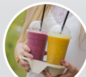
AUCH ALS TO GO